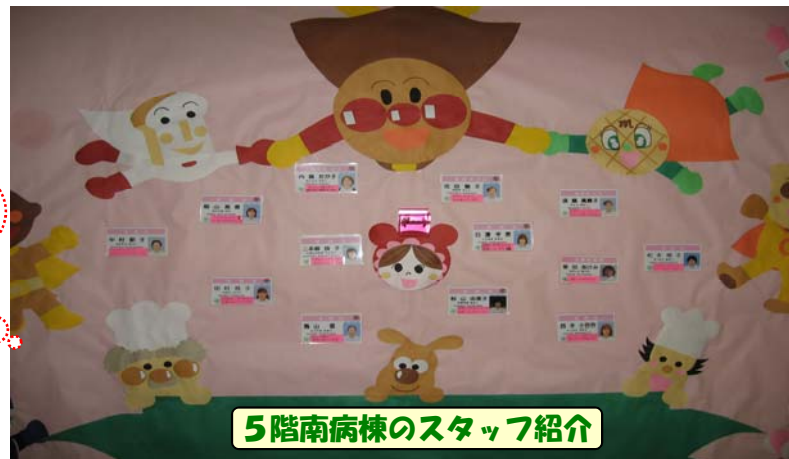
5階南病棟のスタッフ紹介