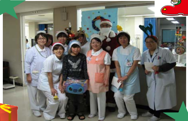
ジングルベル隊出動